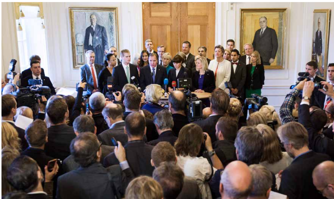
Statsminister Stefan Löfven och den nya regeringen möter pressen i oktober 2014. Statsministern har just presenterat regeringsförklaringen i kammaren.

Talmannen förbereder statsministervalet genom att prata med partiledarna. Syftet är att få en bild av hur regeringen ska sättas samman för att få så starkt stöd i riksdagen som möjligt. Sedan röstar de nyvalda ledamöterna om statsminister.