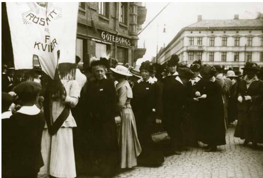
Kvinnor demonstrerar för sin rätt att rösta i Göteborg 1918. År 1921 röstade både män och kvinnor för första gången.

Extra val kan också utlysas efter ett ordinarie val om talmannen efter fyra försök misslyckats med att få statsministerkandidater godkända. Detta har aldrig hänt.