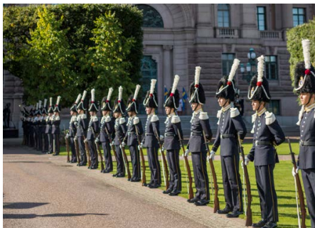
Grenadjärer från Livgardet paraderar traditionsenligt vid riksmötets öppnande.

Livgardet är ett av Försvarsmaktens största förband med många vitt skilda uppgifter. Vid riksmötets öppnande paraderar blåklädda grenadjärer från Livgardet på Riksplan. Det svenska Livgardet fyllde förra året 500 år och är därmed ett av världens äldsta förband.