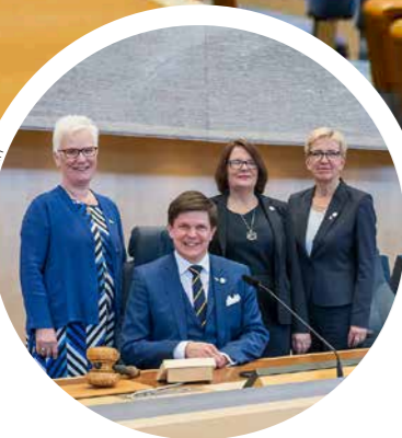
Förste vice talman Åsa Lindestam (S), talman Andreas Norlén, andre vice talman Lotta Johnsson Fornarve (V) och tredje vice talman Kerstin Lundgren (C).